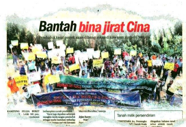
Laporan Sinar Harian mengenai bantahan pembinaan perkuburan bukan Islam pada 12 Januari lalu.