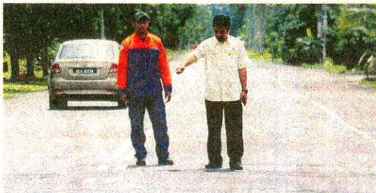
Jalan yang baharu diturap kembali rosak selepas dilalui lori pasir.

Jabatan Pengangkutan Jalan (JPI) dan Polis dapat memantau lori-lori pasir ini kerana ada di antaranya dipandu warga asing.