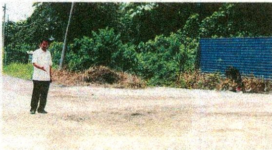
Kerosakan jalan makin kritikal di lokasi.