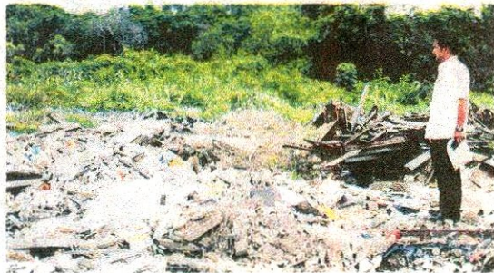
Tapak pembuangan sampah haram bersebelahan depoh penyimpanan pasir.